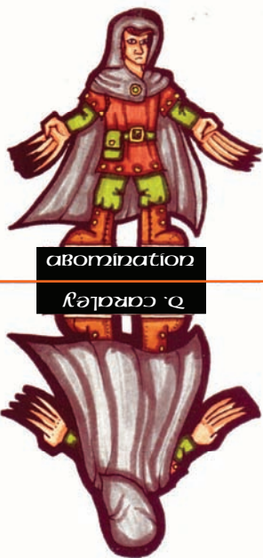
abomination רֵאשׁוֹן אָבִימִינַת