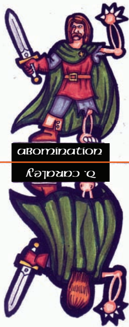
abomination רֵאשׁוֹן אָבִימִינַת