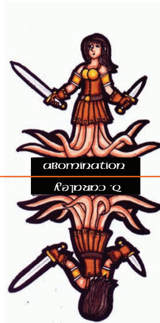
abomination רֵאשׁוֹן אָבִימִינַת