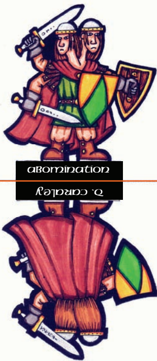
abomination רֵאשׁוֹן אָבִימִינַת