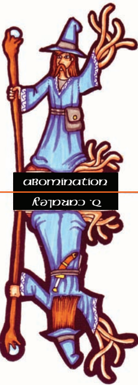
abomination רֵאשׁוֹן אָבִימִינַת

imperfect people abominations By D. Caraley