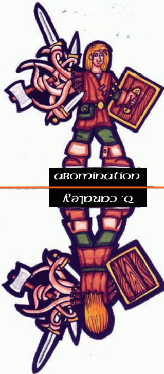
abomination רֵאשׁוֹן אָבִימִינַת