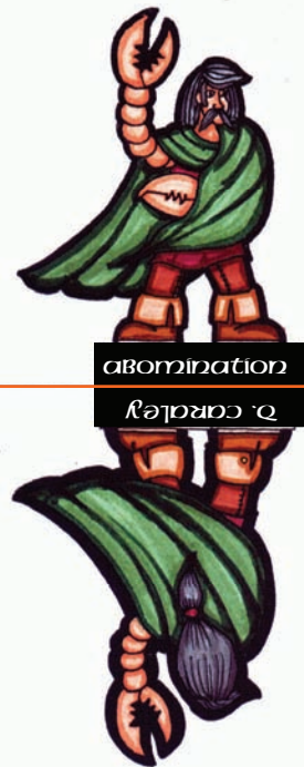
abomination רֵאשׁוֹן אָבִימִינַת